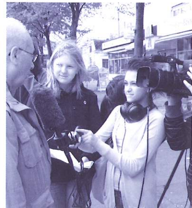
Filmteam „Lurup meine Perle ...“

mit der Programmierung beschäftigt. Anfang des neuen Schuljahres kann die Datenbank von Luruper Schülern genutzt werden.